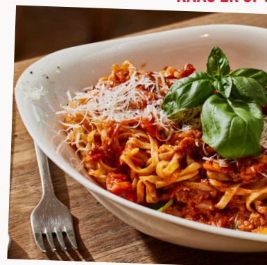
Een gratis portie bij elke pasta!